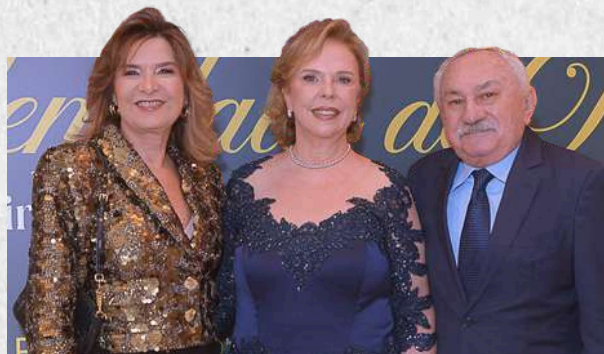
Solenidade de Posse do CRCMG