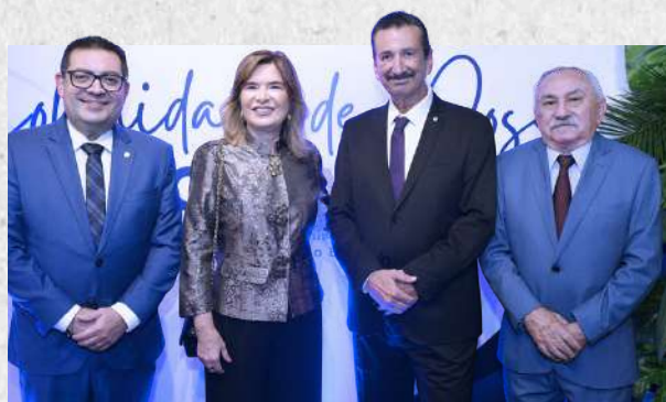
Solenidade de Posse do CRCAL