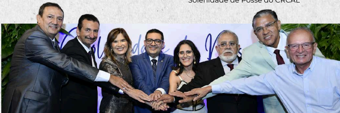
Solenidade de Posse do CRCAL