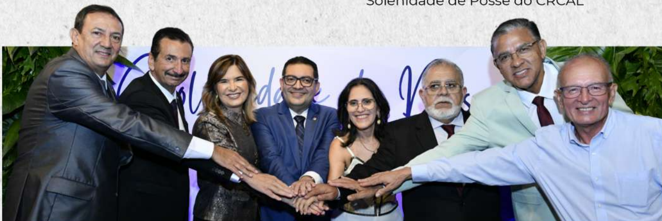
Solenidade de Posse do CRCAL