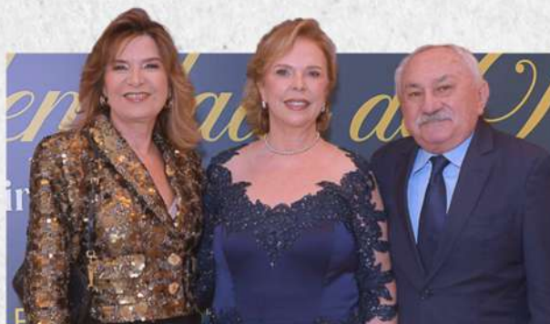
Solenidade de Posse do CRCMG