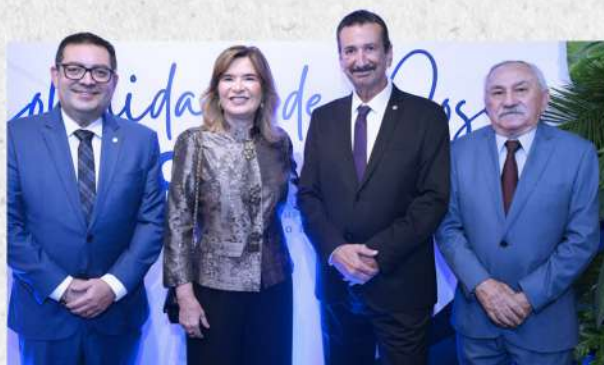
Solenidade de Posse do CRCAL